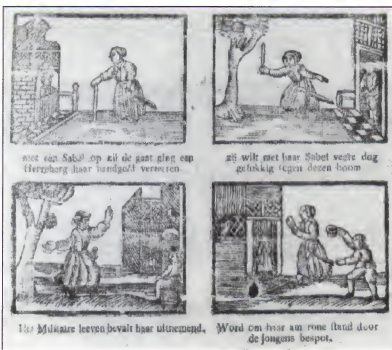
met een Sabot op zij de gaar gien een Herzhurg haar handgolt vertoren.